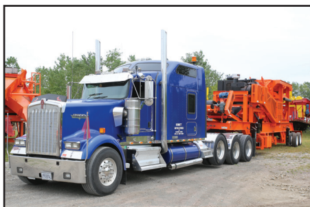
Se transporta fácilmente con solo enganchar. Consulte al departamento de transporte de su localidad.